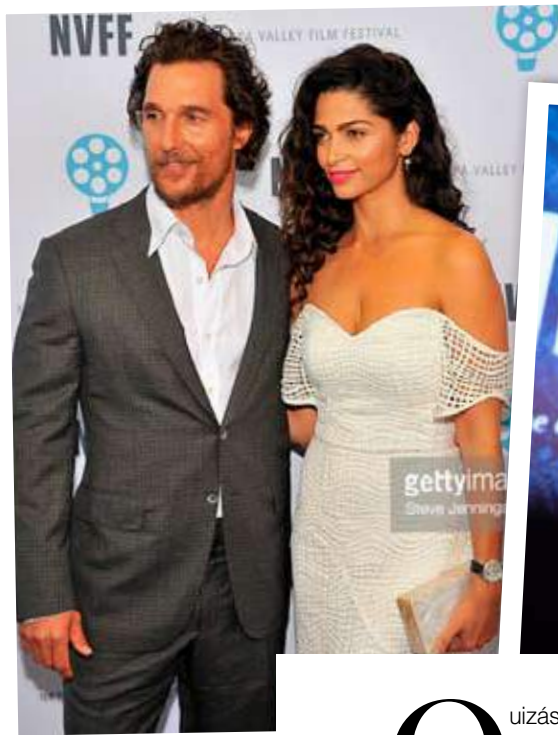
Matthew McConaughey y Camila Alves, en la gala inaugural del festival.