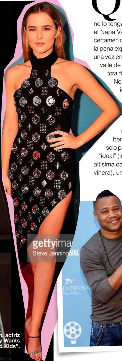
Zoey Deutch, actriz de "Everybody Wants Some!!" y "Good Kids".

Quizás muchos de los cinéfilos que viven pendientes de las novedades en Berlín, Venecia o Cannes no lo tengan en sus radares, pero el Napa Valley Film Festival es un certamen cinematográfico que vale la pena experimentar por lo menos una vez en la vida. El espectacular valle de Napa, la región productora de vino más importante de Norteamérica y un destino idílico para bon vivants provenientes de todo el mundo, ofrece un entorno inmejorable para el deleite cinemero: en este lugar bendecido por un clima que solo podríamos describir como "ideal" (lo que explica también la altísima calidad de su producción vinera), un festival de cine ofrece