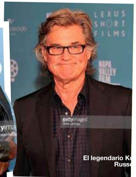
El legendario Kurt Russell.