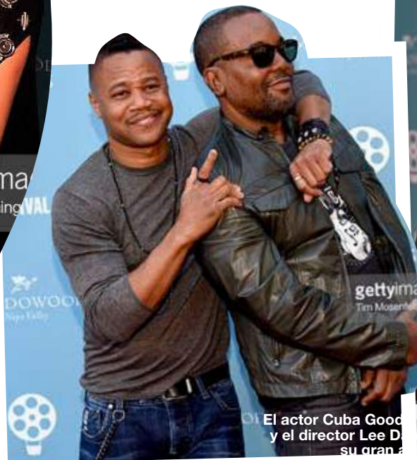
El actor Cuba Gooding Jr. y el director Lee Daniels.

Este festival, que se desarrolla en cuatro localidades del valle (Napa, Yountville, St. Helena y Calistoga), ofrecía además el marco perfecto para el estreno del primer largometraje internacional